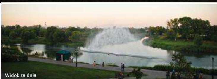
Widok za dnia