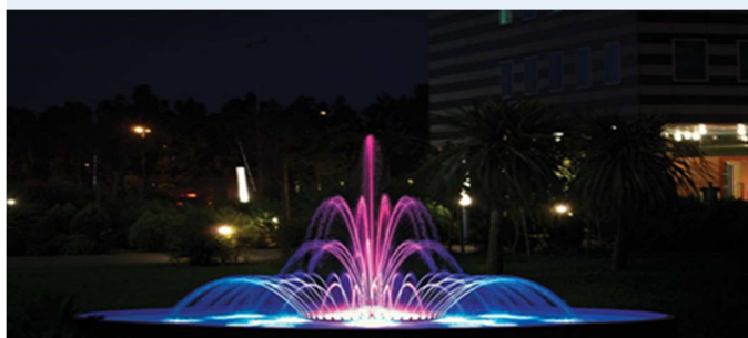
FC 117 strumienie skierowane na zewnątrz pierścienia