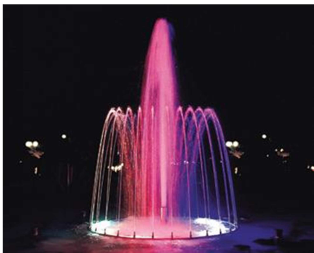
FD 104 strumienie skierowane do wewnątrz pierścienia