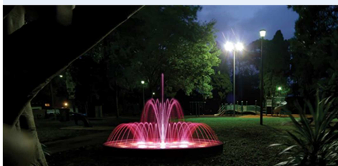
FC 116 strumienie skierowane do wewnątrz pierścienia